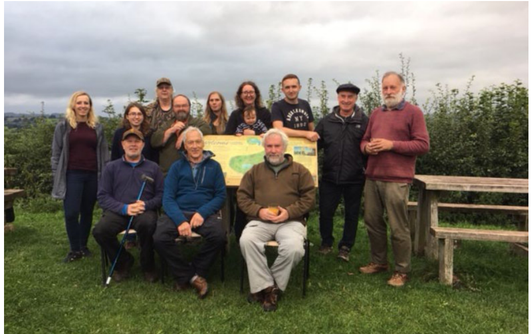
Grŵp Modrwy Llan-gors