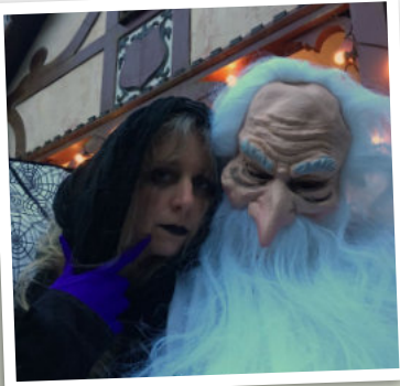
Digwyddiadau iasoer yn y Pafiliwn