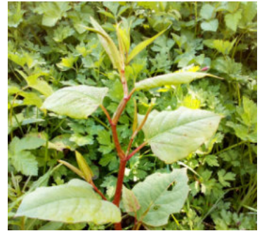
Clymog Japan – cyfnodau cynnar