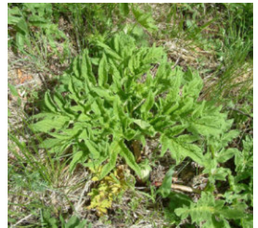
Efwr Enfawr – cyfnodau cynnar