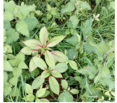
Jac y Neidiwr a danadl

Am wybodaeth bellach ynghylch yr hyn y mae Awdurdod Parc Cenedlaethol Bannau Brycheiniog yn ei wneud, edrychwch ar y prosiect ar ein tudalennau gwe: http://www.beacons-npa.gov.uk/environment/understandbiod/invasive-species-project-invaders-of-the-national-park/