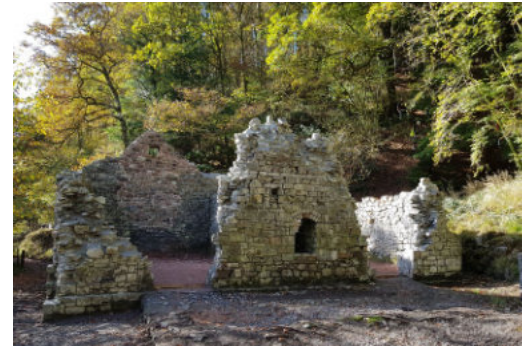
Ar ôl y gwaith atgyweirio