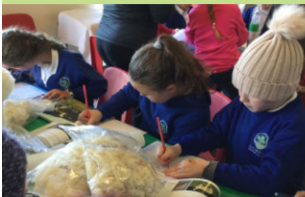
Ysgol Gynradd Gilwern yn dysgu am y Mynyddoedd Du

Dylai grwpiau sydd â diddordeb gysylltu â Lora ar lora.davies@beacons-mpa.gov.uk , neu roi galwad i Dim Addysg Awdurdod Parc Cenedlaethol Bannau Brycheiniog ar 01874-624437 i archebu ymweliad yn rhad ac am ddim. Darperir cludiant yn rhad ac am ddim hefyd.