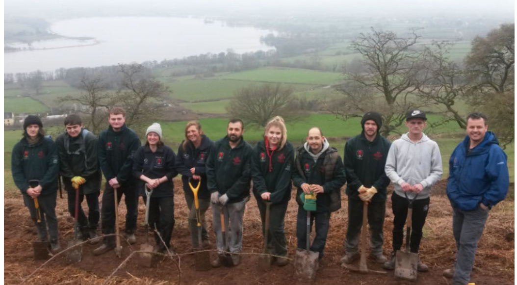
Hyfforddeion Bannau Brycheiniog