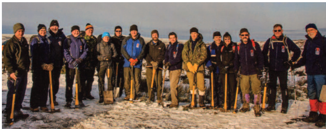
Gwirfoddolwyr yr Ucheldir ar y Bloreng.