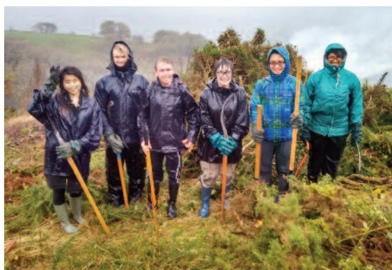
Gwirfoddolwyr o Brifysgol Birmingham yn clirio eithin ac yn edrych braidd yn wlyb.

Treuliodd Gwirfoddolwyr Cadwraeth Prifysgol Birmingham ddeuddydd fis Tachwedd diwethaf mewn tywydd erchyll yn helpu wardeniaid y Parc Cenedlaethol.