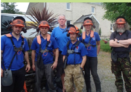
Gwirfoddolwyr Llwybr yr Ucheldir ar ôl hyfforddiant torri prysgwydd

Bydd yr hyfforddiant yn cyfoethogi'r cyfraniad gwerthfawr y mae'r gwirfoddolwyr hyn eisoes yn ei wneud i gadwraeth amgylchedd yr ucheldir.