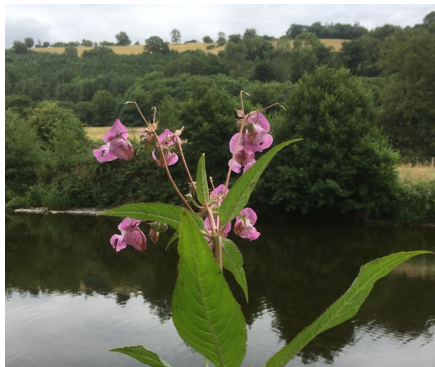
Jac y Neidiwr yn Island Fields, Aberhonddu.