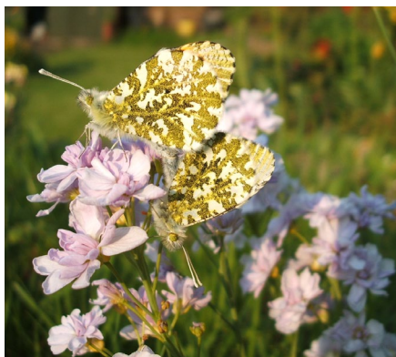
Pili-palaod gwyn blaen oren yn paru.