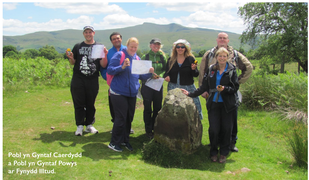
Pobl yn Gyntaf Caerdydd a Pobl yn Gyntaf Powys ar Fynydd Illtud.

Os hoffech gael eich enw ar ein rhestr bostio, neu os hoffech gyfrannu at rifynnau'r dyfodol, cofiwch gysylltu â'r Tîm Cymunedau drwy gyfrwng y Gwyddoniadur Gwasanaethau ar ddiwedd y cylchlythyr hwn. Mae'r cylchlythyr ar gael ar lein hefyd ar http://www.bannaubrycheiniog.org/cymunedau/diweddariad-cymunedol/