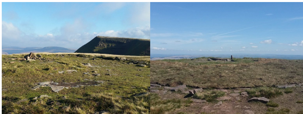
Fan Foel cyn y gwaith cadwraeth Gwanwyn 2017. Fan Foel ar ôl y gwaith Gwanwyn 2018.