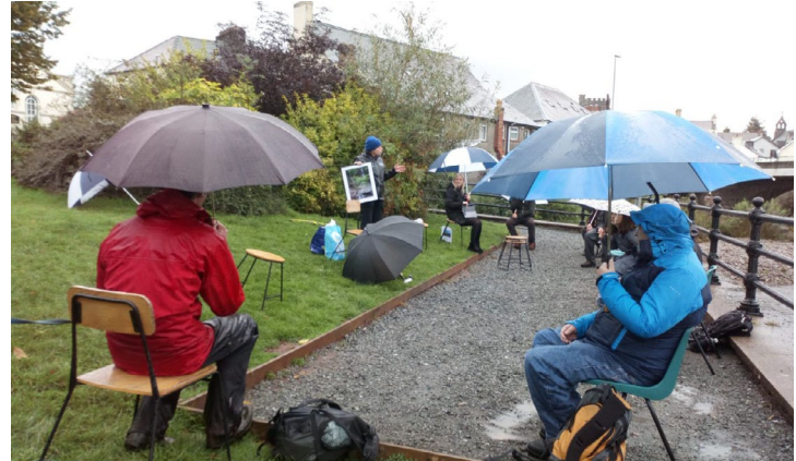
Cyfranogwyr camau bach yn derbyn eu ffotograffau mewn ffrâm er gwaetha'r tywydd.

Y gobaith yw y bydd llwyddiant y prosiect hwn yn arwain at ddatblygu'r gwasanaeth ymhellach a chyfluoedd rhagnodi gwyrdd. Am wybodaeth bellach cysylltwch â Francesca Bell, Swyddog Datblygu Cymunedol francesca.bell@beacons-npa.gov.uk Ffôn: 07854997530