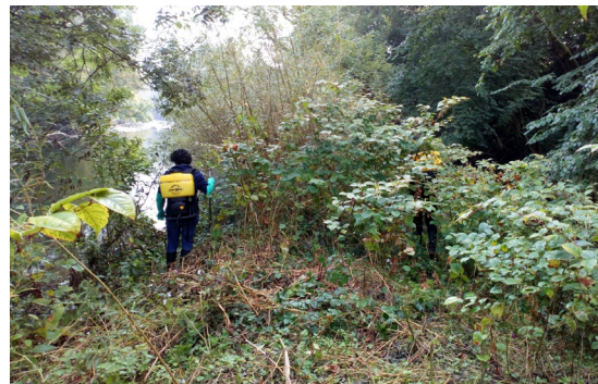
Trin Clymog Japan ar hyd Afon Wysg

Os oes diddordeb gennych mewn helpu neu os hoffech unrhyw wybodaeth bellach am y prosiect cysylltwch â Beverley.Lewis@beacons- npa.gov.uk Ffoniwch: 07854 997 508