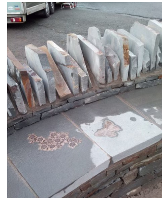
Carreg cerdd Blaen Taf/ Storey Arms.