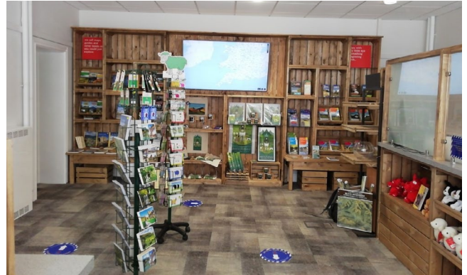
Canolfan Wybodaeth i Dwristiaid y Fenni

Ynghyd â'i bartneriaid mae'r Awdurdod Parc Cenedlaethol wedi agor Canolfan Wybodaeth y Fenni. Bydd ar agor 10am – 4pm ddydd Llun i ddydd Sadwrn yn y cartref newydd yn Neuadd y Farchnad, Stryd y Groes. E-bost: abergavennytic@yahoo.com Ffon: 01873 853254. Mae mesurau Covid-19 mewn lle fel uchod.