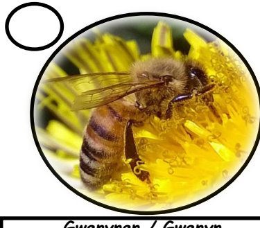
Gwenynen / Gwenyn

Mae'r blodau blewog hyn yn ymddangos yn gynnar yn y gwanwyn dipyn o amser cyn i'r dail ymddangos.