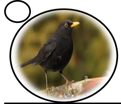
Aderyn Du neu'r Fwyalchen

Planhigion coetir sy'n blodeuo yn ddiweddarach yn y gwanwyn ydy'r rhain, ond efallai y gwelwch chi'r egin gwyrdd yn ymddangos.