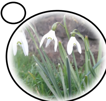
Lili Wen Fach neu'r Eirlys

Mae'n amser prysur i ffermwyr yn y Parc Cenedlaethol gyda digon o wŷn bach newydd yn cael eu geni.