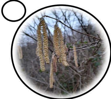
Collen - Cynffonau Wŷn bach

Mae'n hyfryd sylwi ar y dyddiau'n ymestyn yn y gwanwyn. Mae yna gymaint o bethau i edrych allan amdanynt sy'n dweud wrthym fod y gwanwyn wedi dechrau. Ewch am dro yn lleol i weld faint o arwyddion o'r gwanwyn allwch chi sylwi arny'n nhw gan roi tic iddyn nhw isod.